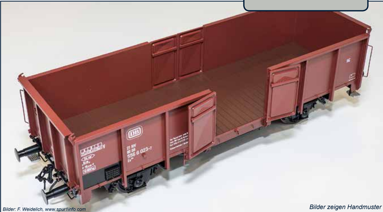
Bilder: F. Weidelich, www.spur1info.com

Mit voll funktionsfähigen Seitenwandtüren!